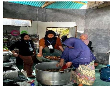
Gambar 3. Kegiatan produksi kelompok UMKM minuman sari pala dan selai pala