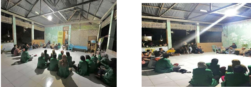
Gambar 1. Proses FGD bersama kelompok inti dalam menumbuhkan dream

masyarakat setempat dalam membangun mimpi dan prinsip low hanging fruit yakni dengan mengidentifikasi peluang dan kesempatan yang dapat dengan mudah diraih dengan merujuk pada aset dan potensi yang dimiliki.