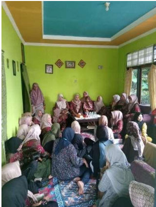
Gambar 2. Proses pembentukan struktur UMKM