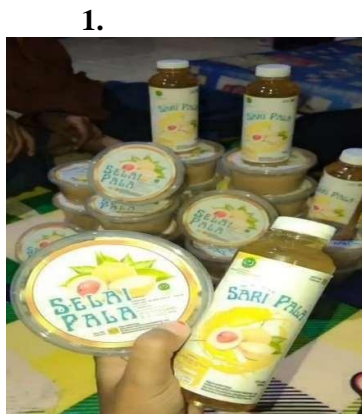
Gambar 5. Foto Produk minuman sari pala dan selai pala

Setelah merealisasikan program yang telah dirumuskan oleh kelompok UMKM, maka tahap Destiny adalah tahap dimana masing-masing anggota kelompok mengimplementasikan berbagai hal yang sudah di rumuskan pada tahap Design . Pada tahap destiny harus dibarengi dengan kontinuitas dari kelompok UMKM dalam tahap ini berlangsung ketika organisasi secara kontinyu menjalankan perubahan, memantau perkembangannya dengan membuat inovasi-inovasi baru.