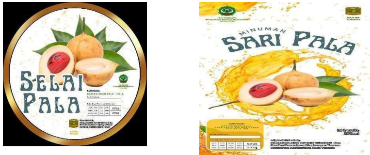
Gambar 4. Brand atau Logo

UMKM minuman dan selai pala. Untuk kemasan kami menggunakan botol karena lebih simple dan mudah di dapatkan. Kami melakukan pengadaan kemasan dan brand yang telah disepakati Bersama. Adapun brand atau logo dari UMKM Minyak kelapa murni sebagai berikut: